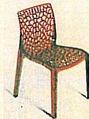
Il modello Gruvyer

mette inoltre di ottenere tutte le certificazioni Sicurezza Prodotto. L'azienda, che appartiene al Gruppo Igap, ha la ferma convinzione che sia necessario evolversi in un mondo che cambia continuamente, pur attingendo dal passato e dalla tradizione i propri punti di riferimento. È proprio questa filosofia che circa un anno fa ha spinto Grand Soleil a investire in una nuova linea di prodotti che, affiancati a quelli storici, potesse aprire nuovi orizzonti di business e contestualmente lanciare una nuova sfida aziendale. Nasce così Upon, una collezione di sedute dalle linee giovani e dinamiche, versatili al punto di poter arredare sia l'interno sia l'esterno, senza rinunciare alla massima qualità dei materiali, alla bellezza del progetto italiano e, non da meno, al prezzo molto competitivo. Fanno parte della gamma sedie per arredare, creare, vivere di colore e luce, realizzate in resine e policarbonati trasparenti per poter rendere esclusivi tutti gli ambienti, dagli spazi aperti ai locali più prestigio-